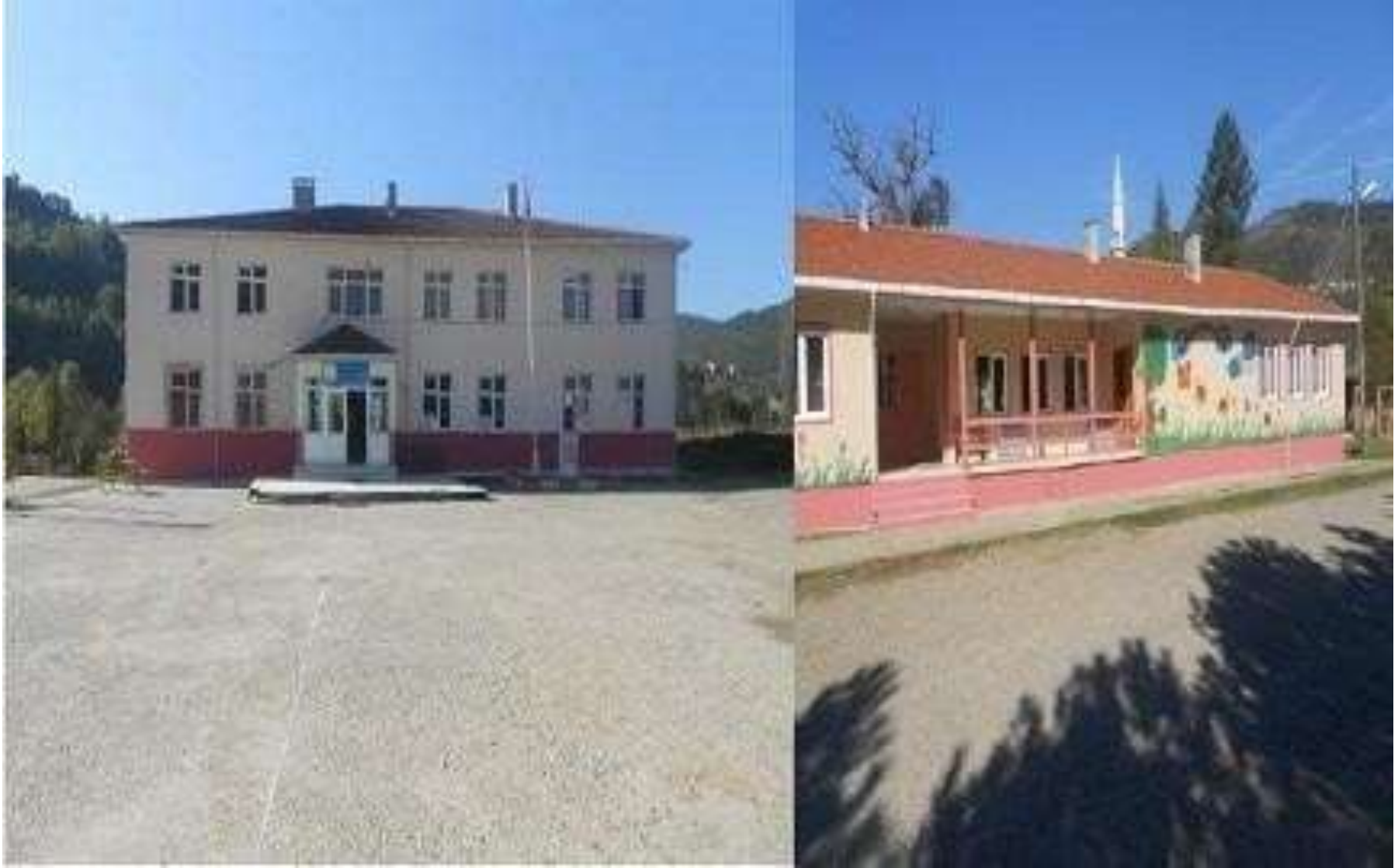
ÇAYIR İLKOKULU/ ÇAYIR ORTAOKULU